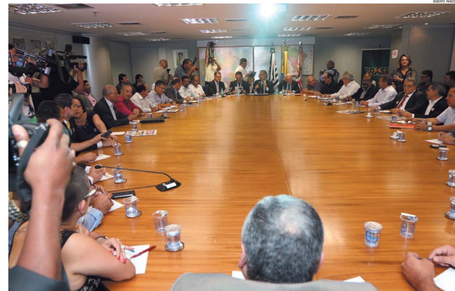
Sindicalistas durante encontro com ministros no Escritório da Presidência da República, em São Paulo

“Já que o governo se comprometeu a debater a nossa pauta, que inclui itens como alternativa ao fator previdenciário, redução de jornada para 40 horas sem redução de salário, redução dos juros e do superávit primário, o combate a terceirização e à rotatividade,