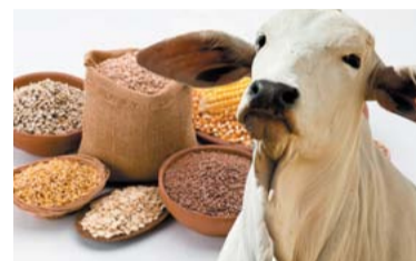
PRODUTOS PRIMÁRIOS – 2

O índice que acompanha as matérias-primas, como arroz e minério de ferro, registrou em janeiro queda de 5,14%, na comparação com dezembro.